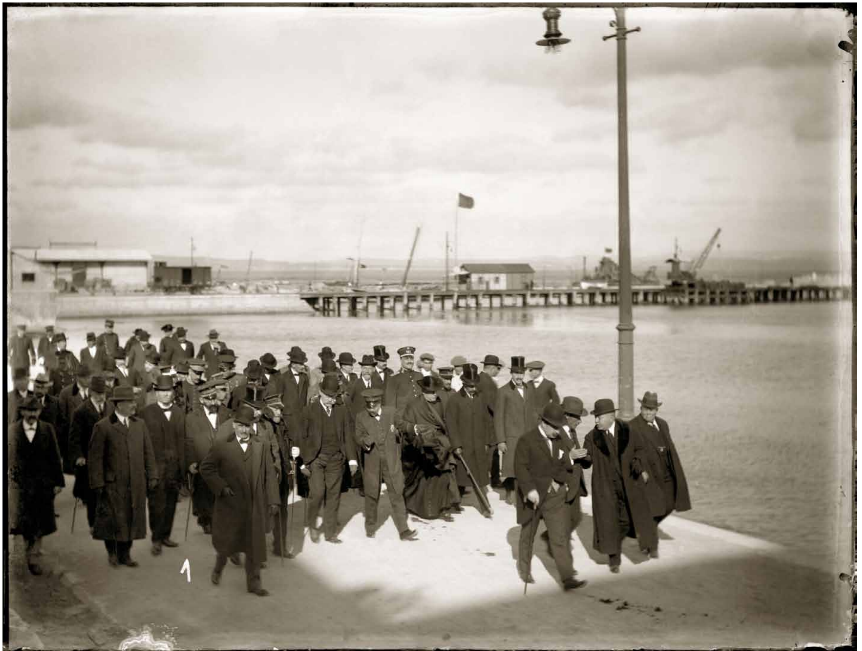
Mayo de 1913. Visita del ministro de Fomento Miguel Villanueva al Puerto de Algeciras, en la que se colocó la primera piedra del muelle de Alfonso XIII, siendo también conocido como Muelle de la Galera