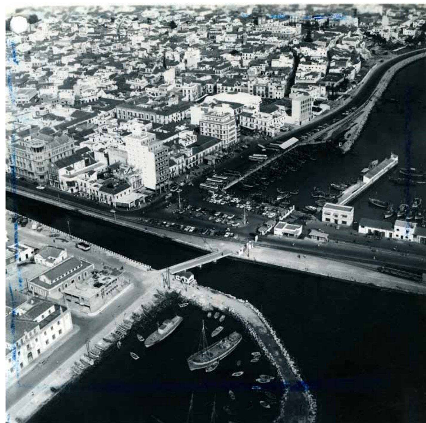
Vista aérea del Muelle Villanueva. Año 1964

Por los referidos motivos no nos atrevemos el día de hoy a recomendar ninguno de estos dos sistemas de pesca, ya que sabemos a ciencia cierta que los barcos tradicionales de Bermeo desplazados a Dakar han realizado siempre una buena pesca en proporción a sus gastos de explotación y con este sistema utilizando transportes frigoríficos como recomendamos tenemos la certeza de que la pesca sería realmente abundante y económica.